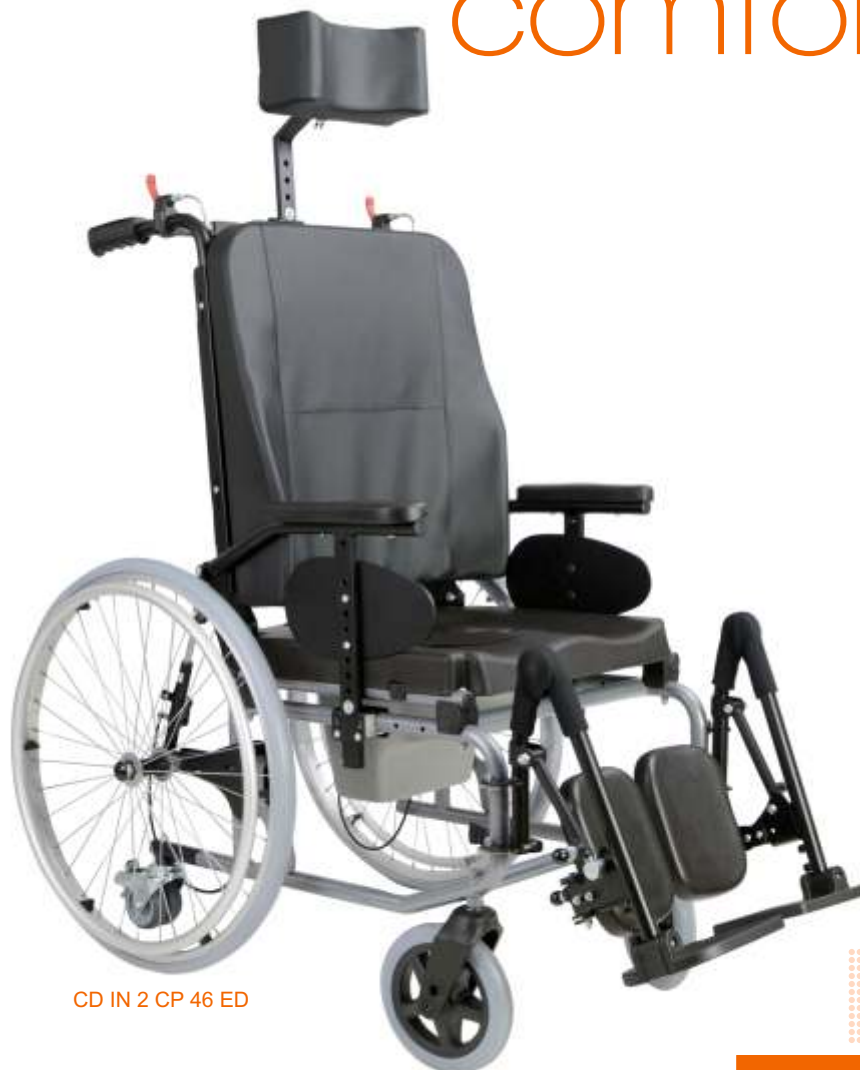
CD IN 2 CP 46 ED

A COMFORTPLUS combina as vantagens de uma cadeira cama e de uma cadeira sanitária com possibilidade de utilização directa no WC. De elevado conforto com assento sanitário anatómico, encosto rígido com duas faixas tensoras lombares e encosto de cabeça em U ajustável em altura. Permite a reclinção do encosto e a elevação dos patins ao mesmo nível do assento. Apoia braços destacáveis para acesso mais fácil ao utilizador. Estrutura em aço, com rodas traseiras de Ø600mm, rodas dianteiras de Ø200mm e dois rodízios de Ø50mm proporcionando total estabilidade da cadeira.